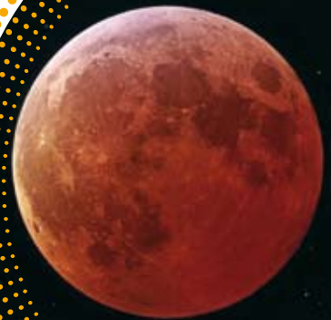
Lors des 50 ans du site, Gérard Rousseau a sensibilisé le public sur la lutte contre la pollution lumineuse...